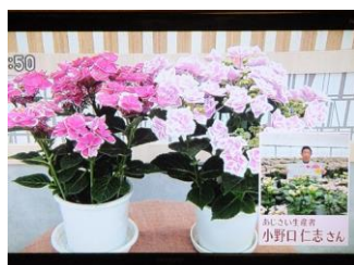
4/28 あじさい 小野口 仁志氏 (鹿沼市)