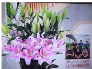
4/14 オリエンタルユリ JAうつのみや 球根切花専門部 (宇都宮市)